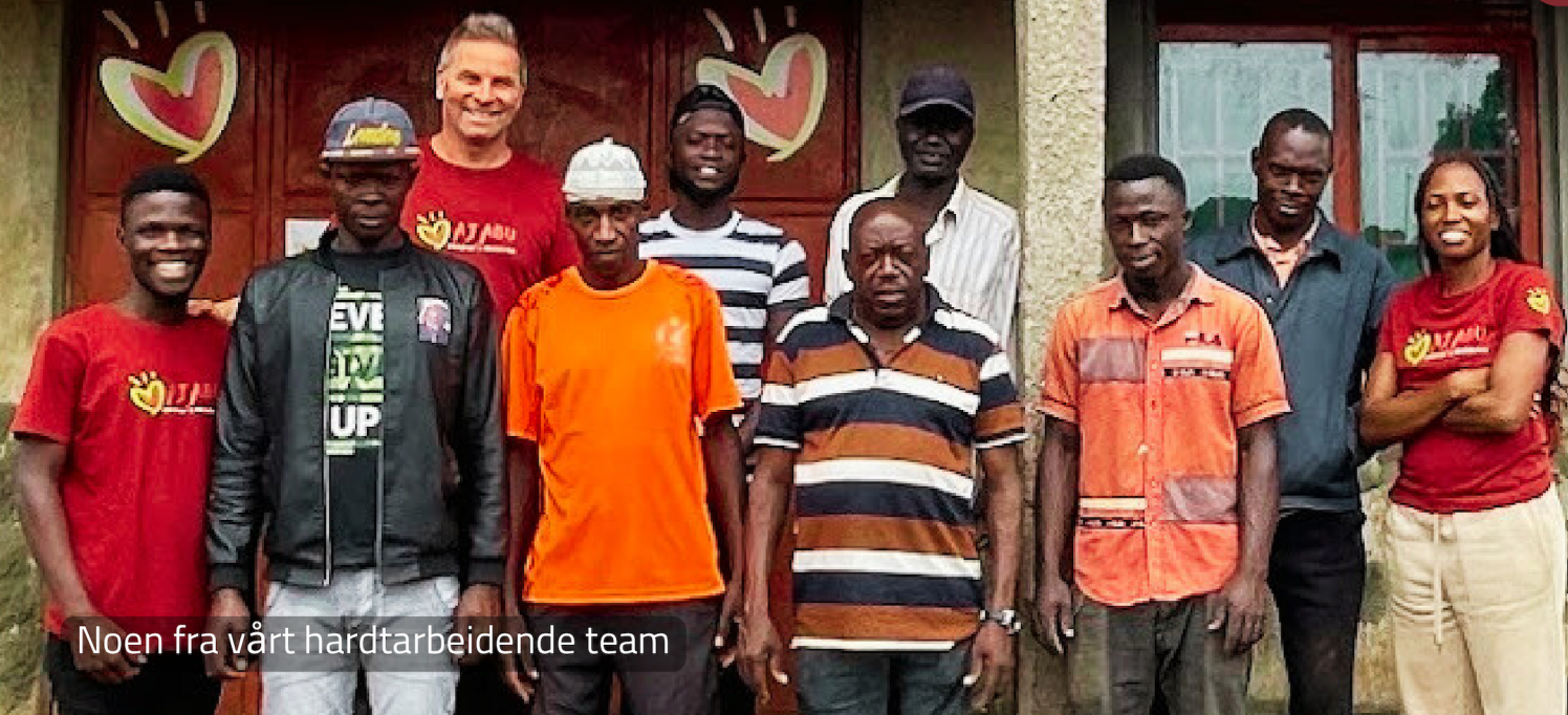
Noen fra vårt hardtarbeidende team