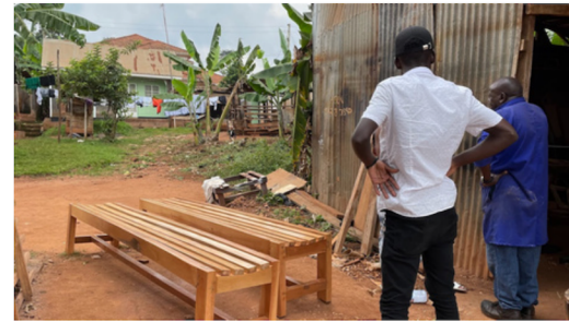
Benkene til venterommet nydelig utført av vår snekker