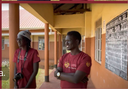
Vi besøker en av skolene vi samarbeider med 17 km fra Bubwa.