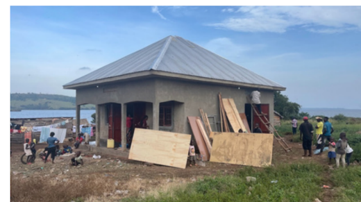
Siste del av arbeidet starter 30.juni