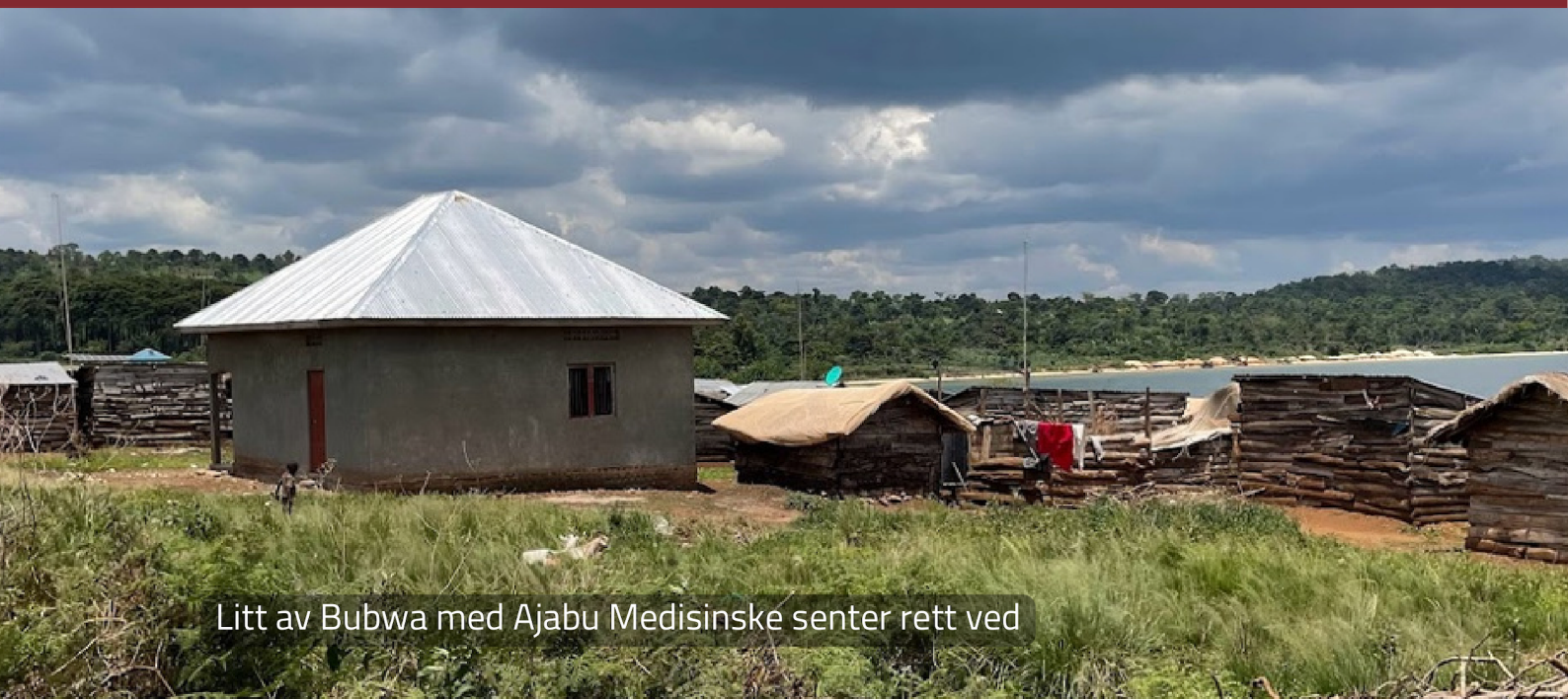
Litt av Bubwa med Ajabu Medisinske senter rett ved