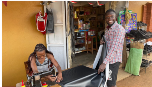
Mange bidro i arbeidet med å få senteret ferdig i 2023