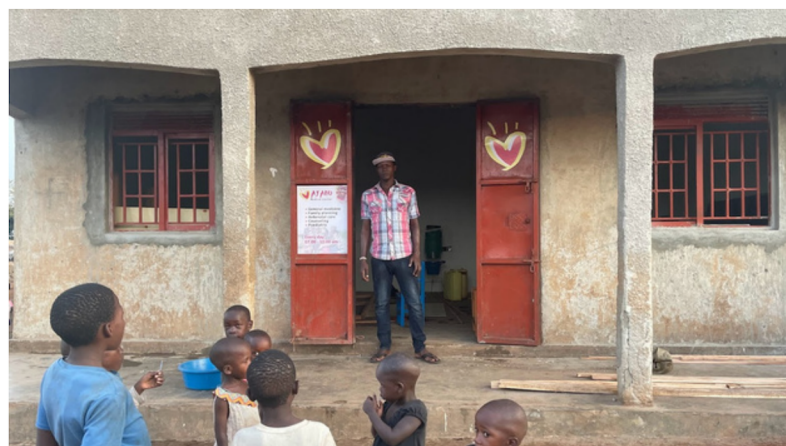
Bygningen klar til å males i front