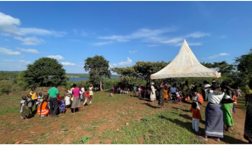
Medisinsk outreach 2022