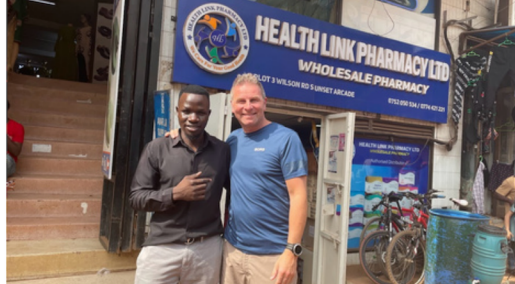
Vår samarbeidspartner for medisin i Kampala