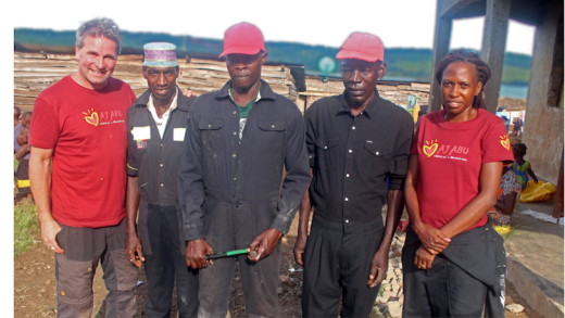
Grunnleggerne sammen med noen arbeidere