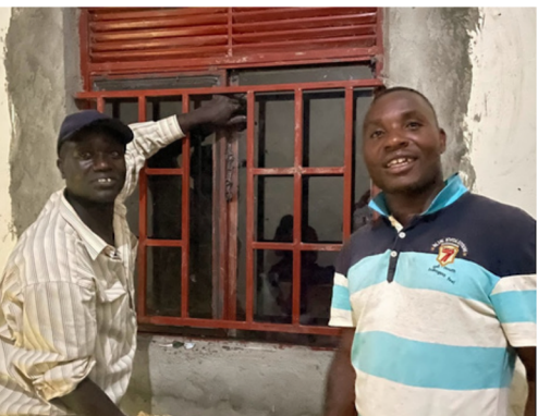
Arbeidere setter inn vinduene