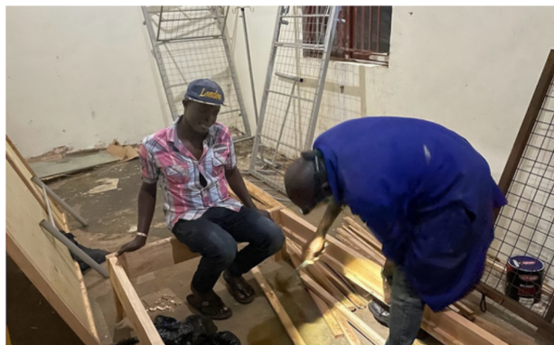
Snekkeren med hjelpere setter opp delevegger