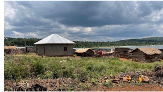
Bygningen vi ønsket som helsesenter