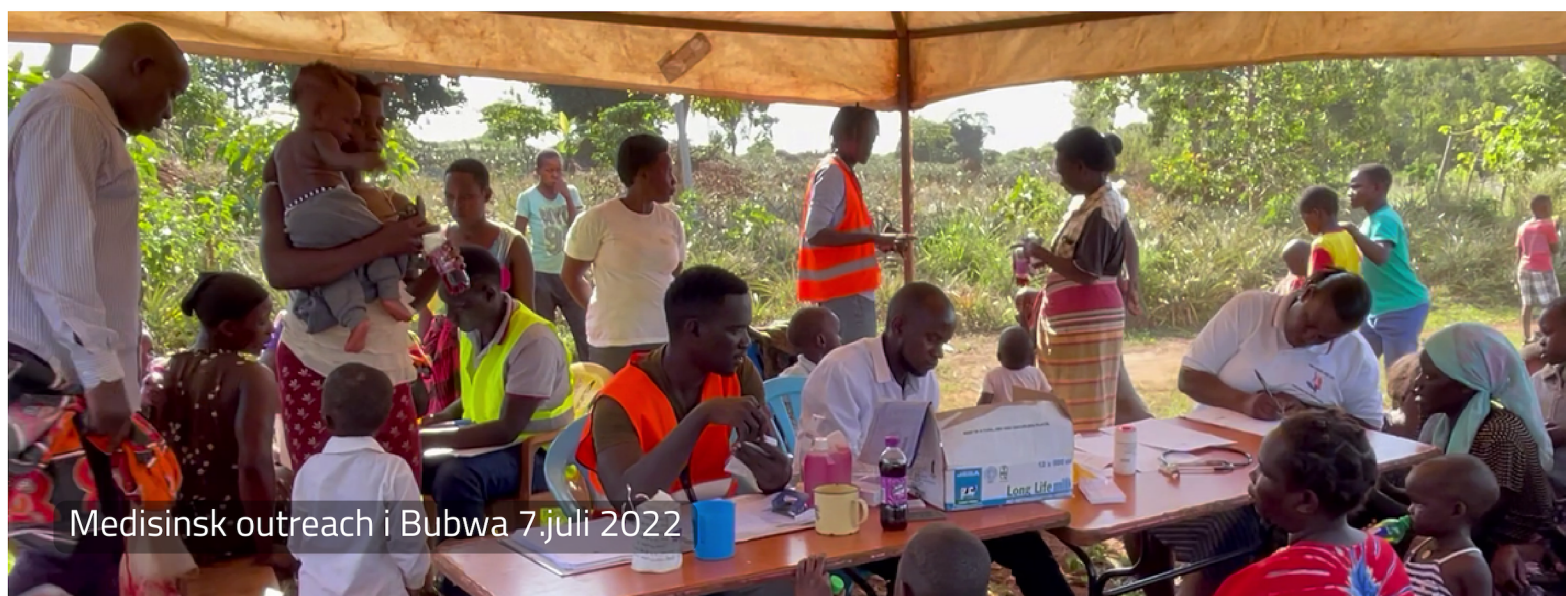
Medisinsk outreach i Bubwa 7.juli 2022