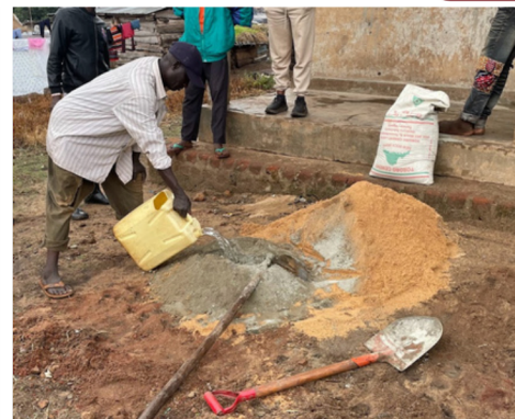
Blanding av murpuss