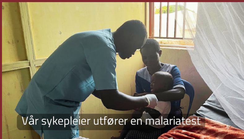
Vår sykepleier utfører en malariatest

Det medisinske senteret tilbyr grunnleggende helsetjenester og er bemannet av dedikerte fagfolk. I 2023 har vi hatt to sykepleiere og en lege i turnus. Helsehuset har som mål å møte helsebehovene til den vanskeligstilte befolkningen i Bubwa. Senteret tilbyr tjenester som generelle kontroller, vaksinasjoner og grunnleggende medisinske behandlinger.