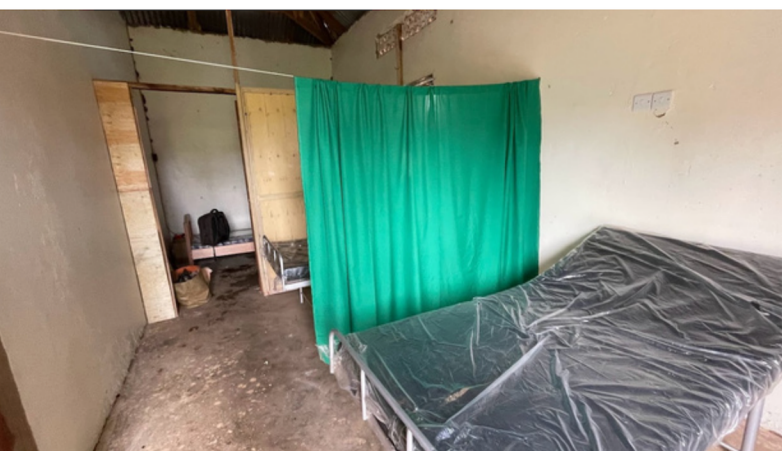
Klargjøring av sengeposten