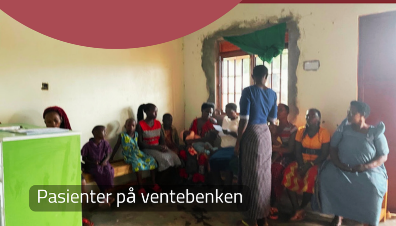
Pasienter på ventebenen

Den 2. juli 2023 var landsbyen Bubwa vitne til en viktig begivenhet med åpningsdagen til Ajabu Medisinske Senter. Spenningen og forventningen var til å ta og føle på da innbyggere, lokale ledere og helsepersonell samlet seg for å feire innvielsen av dette sårt tiltrengte helsehuset. Mange hadde tatt på seg finstasen for å gå på legebesøk denne dagen!