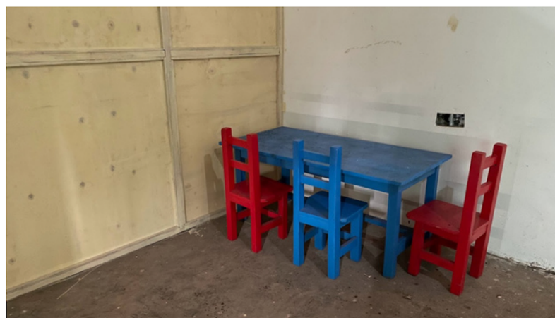
Barnas ventehjørne nesten ferdig...