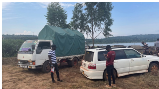
Endelig i Bubwa etter 5 timers tur