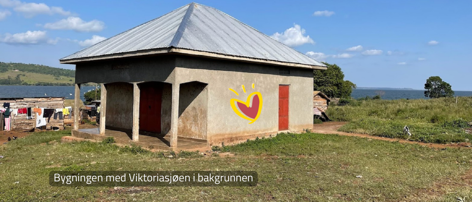
Bygningen med Viktoriasjøen i bakgrunnen