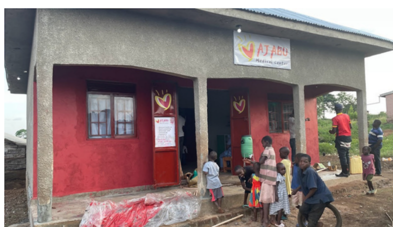
Ajabu Medisinske senter 2.juli 2023