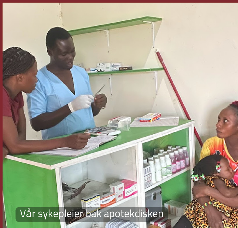
Vår sykepleier bak apotekdisken