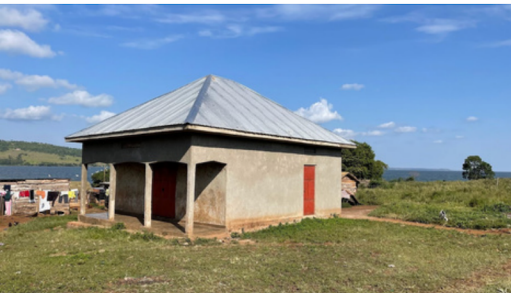
Bygningen med inngangspartiet