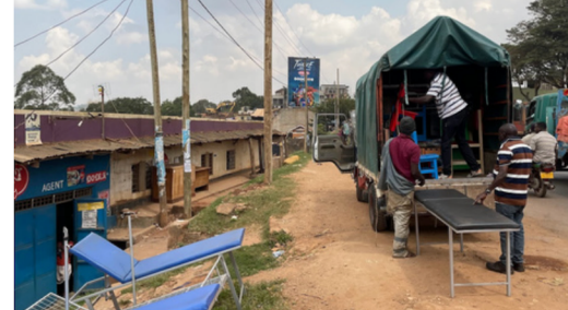
Medisinsk utstyr og møbler lesses inn i lastebilen på vei til Bubwa