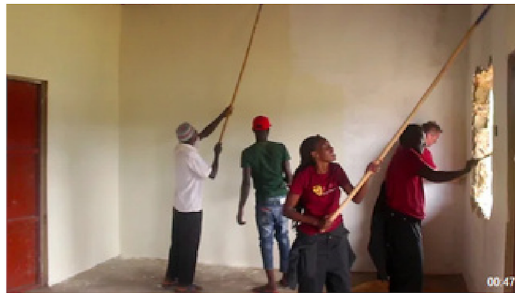
Oppstart av renovering 2022